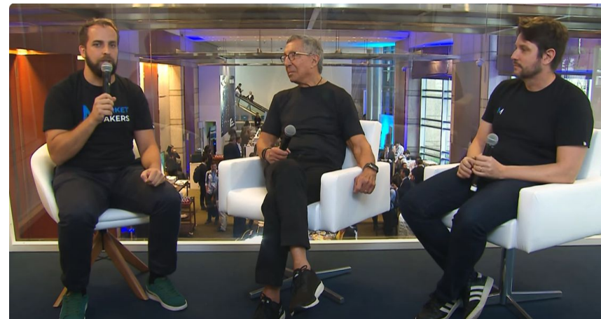
Market Makers na Laic (Credit Suisse) em 2023