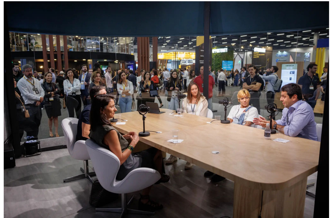
XP Expert 2022 - Infomoney (acima)